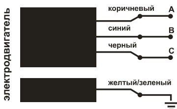
Рис. 4 Принципиальная электрическая схема

Наращивание электрического кабеля должно осуществляться посредством термоусадочной муфты с клеевым внутренним слоем, обеспечивающим герметичность соединения.